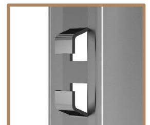
CW - Doppelhaken