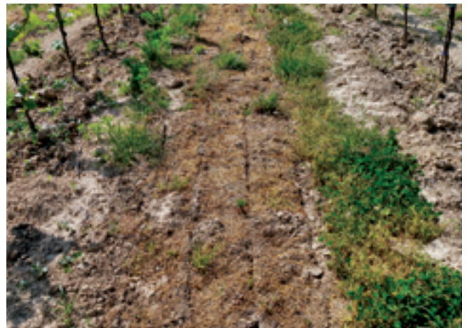
Die unterschrittene Pflanzendecke stirbt ab und schützt den Boden vor Sonneneinstrahlung, Austrocknen und Erosion.