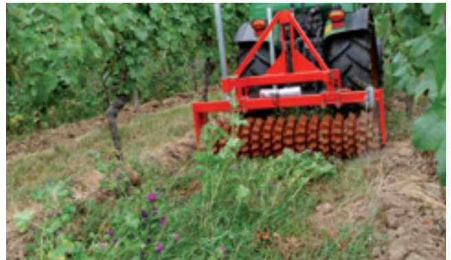
Niedrige Intensitätsstufe: Wachstum hemmen durch walzen.