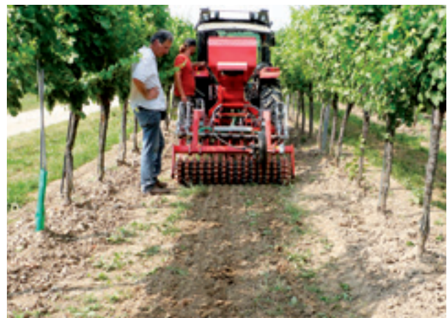
Ansaat von Blühstreifen in offenen Fahrgassen. Flaches wassersparendes Bearbeiten.