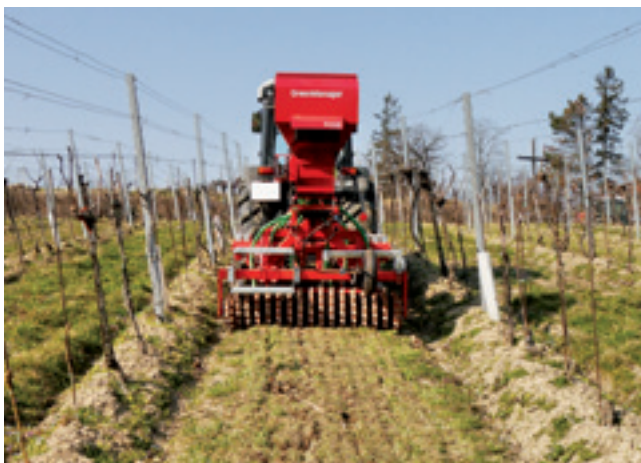
Der Grubber unterfährt den Bestand ohne zu mischen. Der Boden bleibt bedeckt: Wassersparend, Erosionsschutz.