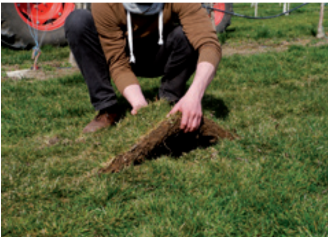
Höchste Intensitätsstufe: Wachstum stoppen durch Unterschneiden. Sollte es danach ausgiebig regnen, kann sich die Begrünung regenerieren und weiter wachsen. Sie können nichts falsch machen.