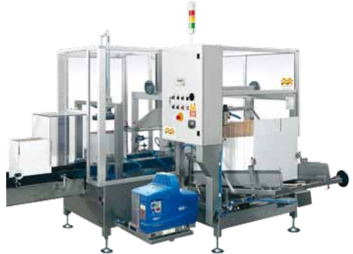
Kartonauffalter mit Heißleimstation