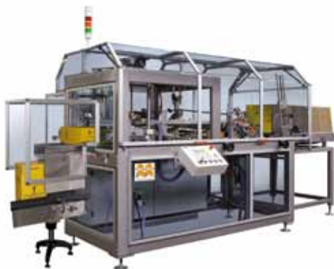
Hochleistungskartonauffalter in mechanischer Bauart