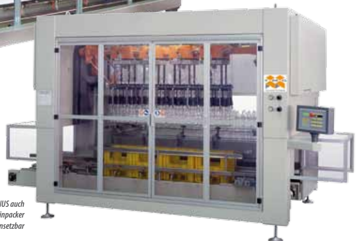
Als Serie ENUS auch als Kisteneinpacker einsetzbar