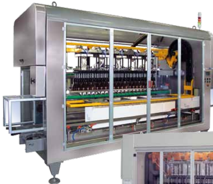
Mehrkopfmaschine META 2 - META 5