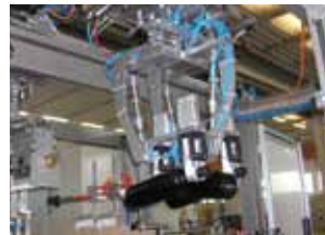
Flaschen werden gegenläufig geschwenkt ...