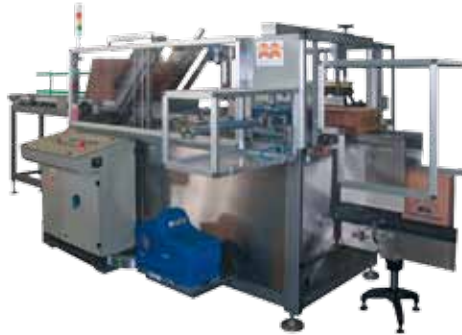
Kartonauffalter mit horizontalem Stempel