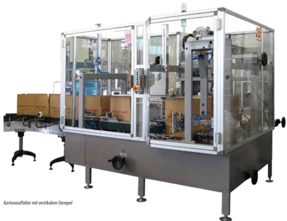
Kartonauffalter mit vertikalem Stempel