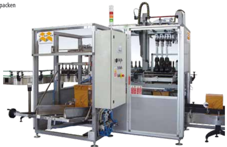
Combi 8 – Kompakt und übersichtlich