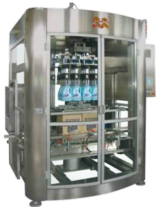
Kompakte Rundlaufmaschine für hohe Leistung