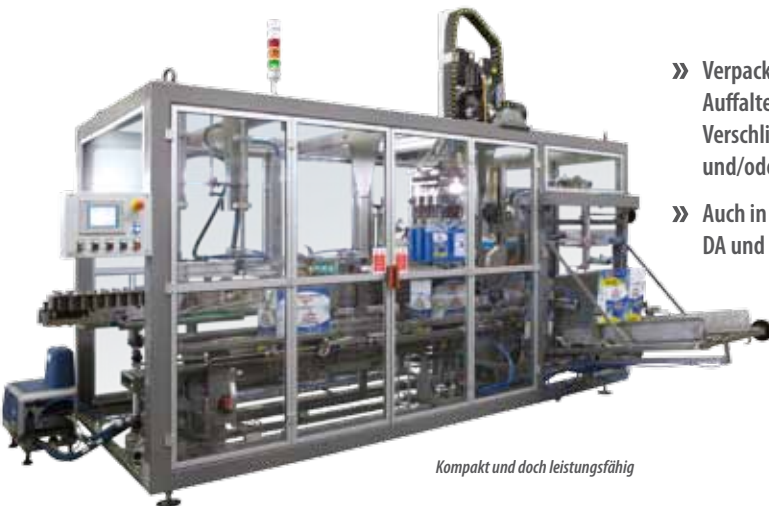
Kompakt und doch leistungsfähig

» Verpackungsinselfür Auffalten, Einpacken und Verschließen mit Klebeband und/oder Heißleim