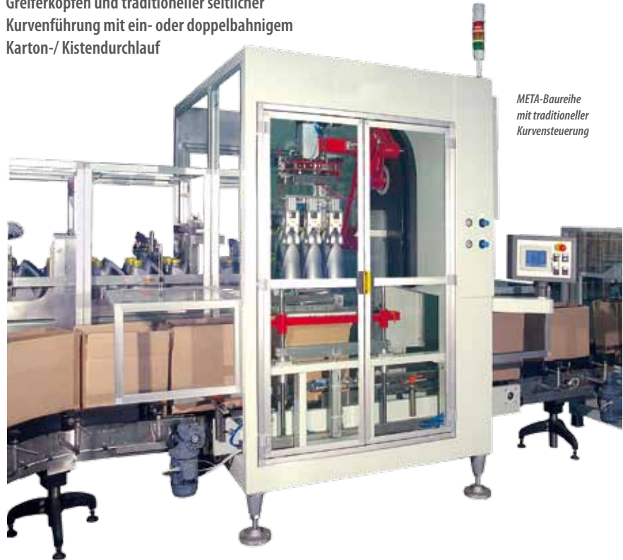
META-Baureihe mit traditioneller Kurvensteuerung