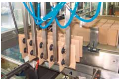
Einsetzen der Gefache in den Karton