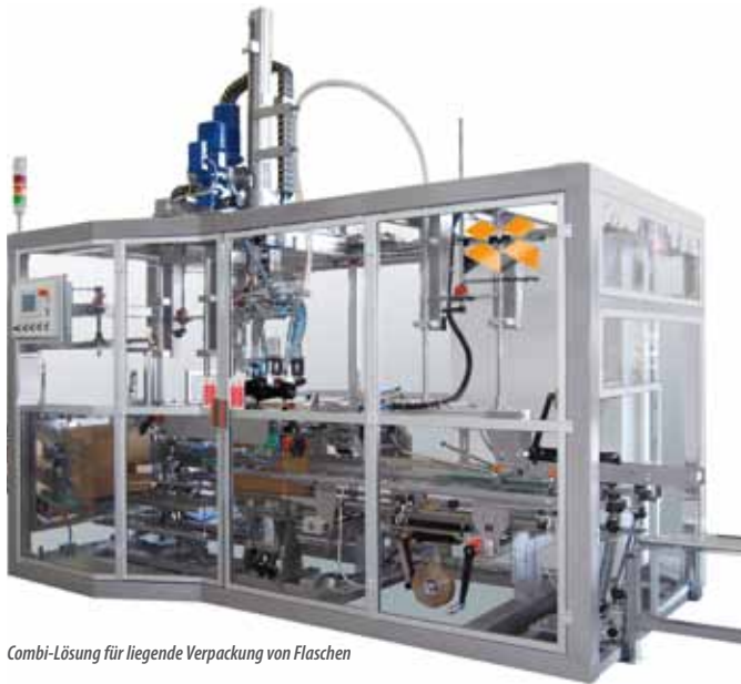
Combi-Lösung für liegende Verpackung von Flaschen

» Verpackungsinselfür liegende Verpackung von Flaschen aus der Wein- und Sektindustrie