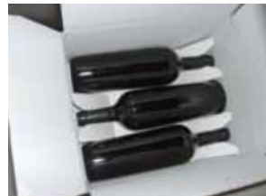
... und liegend verpackt