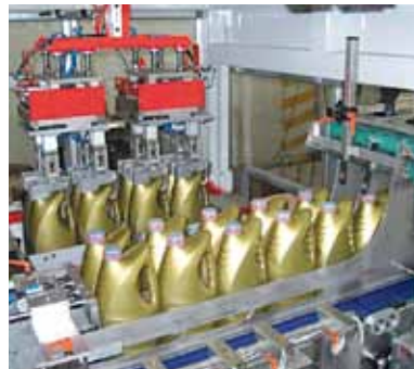
Gasseneinteilung in der Gebindegruppierung