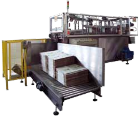
Modulweise Erweiterung des Kartonzuschnittmagazins