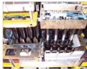
Im 1. Arbeitsschritt (rechts) stehend im 2. Arbeitsschritt (links) kopfüber Verpacken