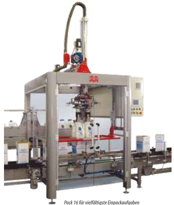
Pack 16 für vielfältigste Einpackaufgaben