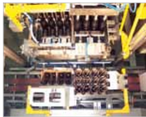
Draufsicht auf Packbereich