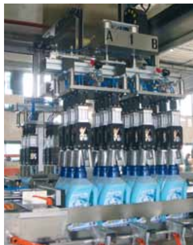
Rotationsmaschine die gleichzeitig greift und setzt