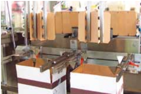
Auffalten der vorgesteckten Gefache