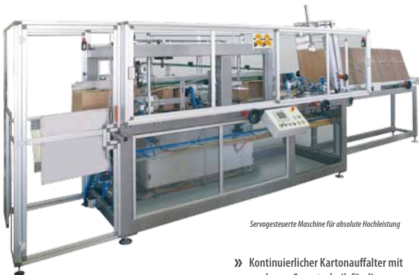
Servogesteuerte Maschine für absolute Hochleistung

» Kontinuierlicher Kartonauffalter mit moderner Servotechnik für die Anwendung im Hochleistungsbereich