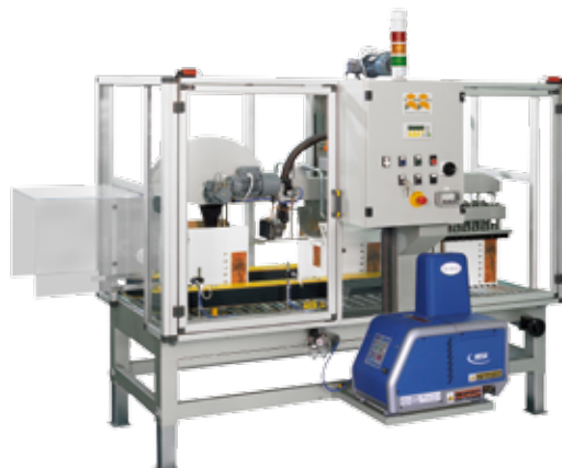
Kartonverschließer mit Heißleim