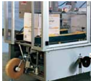
Karton verkleben mit Klebeband