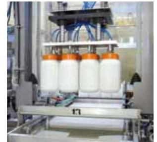
Einsetzen der Produkte in den Karton