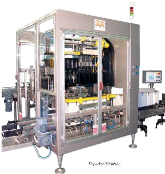
Einpacker tête bêche