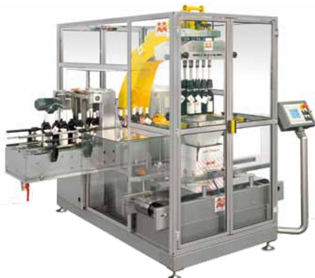
Robopacker mit programmierbarem Bewegungsablauf