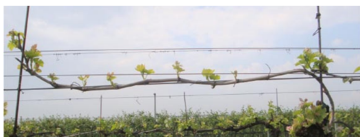
oben Kontrolle / unten 1,5 l / ha BetaB

Versuche der Biolchim zeigen beim Einsatz im Wollstadium bis zum Aufbrechen der Knospen eine Förderung des gleichmäßigen Austriebs. Die Anzahl an Augen die nicht austreiben, kann mit BetaB (Aufwandmenge 1,5 l / ha) deutlich verringert werden.